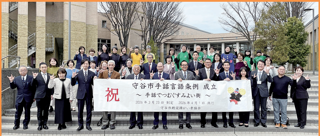
議案可決後の集合写真