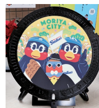
東京ヤクルトスワローズとのコラボデザインマンホール蓋

A 募集チラシの配布など各種PR活動に加え、入団要件を「市内在住」から「市内に在住または市内に勤務」に変更した。