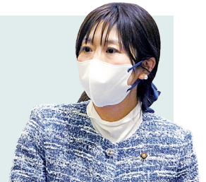
椎名 愛子 議員

A 駅西側の土塔中央保育所が老朽化のため建て替えを検討中であり、守谷駅東側に、子育て関連施設との併設を検討している。