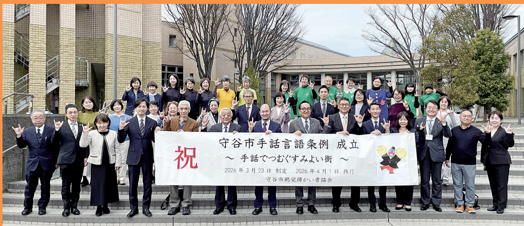
議案可決後の集合写真