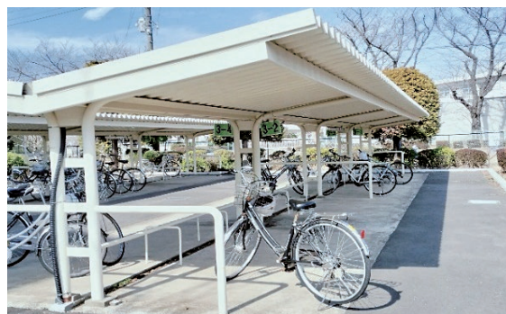
現在の御所ヶ丘中学校の自転車駐輪場

A いて、公平性の観点からどう認識しているのか。 自転車通学により、通学時間は短縮されるが、子どもたちの通学の安全性を最重視して考えなければならないと認識している。